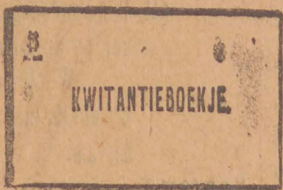
100 vel kwitanties